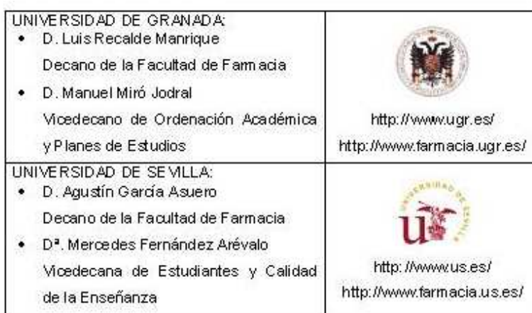
Figura 1. Coordinación de la Guía Única de la Titulación de Farmacia de Andalucía (ECTS).

Como se indicó anteriormente, el punto de partida fue elaborar y publicar la “Guía Única de la Titulación de Farmacia de Andalucía” conforme al sistema ECTS, por parte de las Facultades de Farmacia de las Universidades de Granada y Sevilla (2005 – 2006), proceso coordinado por la Universidad de Granada. Esta acción, incluida en los Planes Propios para la convergencia europea de ambas Universidades, estuvo promovida por la Dirección General de Universidades de la Junta de Andalucía. La coordinación de la Guía Única corrió a cargo del Profesorado indicado en la figura 1.