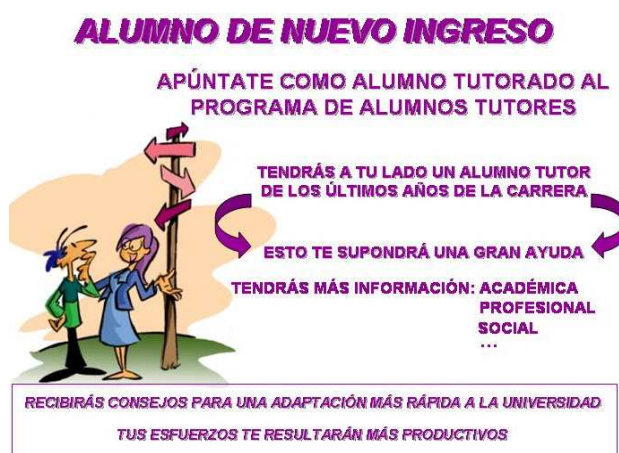
Figura 5. Cartel empleado para anunciar el Programa de Alumnos Tutores.

En ella, los alumnos de primero se encuentran tutorados por alumnos de los últimos años de carrera, y éstos a su vez por profesores tutores. Durante las reuniones entre ellos, uno de los temas en donde se hace especial hincapié es en suministrar información a los alumnos de nuevo ingreso sobre qué es lo que se espera de ellos con relación a las nuevas estructuraciones metodológicas propias del EEES. En la figura 5 se muestra la cartelería empleada en la pantalla de la Facultad con relación al programa de Alumnos Tutores.