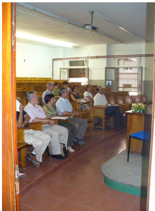
Instantáneas que recogen momentos de la participación en los distintos talleres. De derecha a izquierda y de arriba abajo: Taller de Metodología, Innovación docente, Evaluación de aprendizajes y Estudiantes en el EEES.