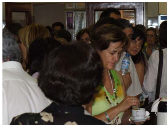
Imágenes del congreso: exposición de pósters i momentos de descanso