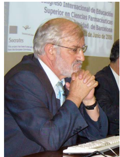
Benjamín Suárez Comisionado del Espacio Europeo de Educación Superior