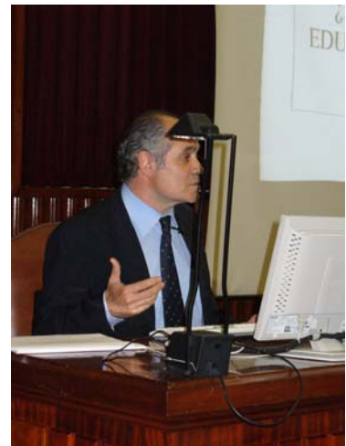
Instantáneas que recogen momentos de las intervenciones de todos los participantes en la sesión inaugural.