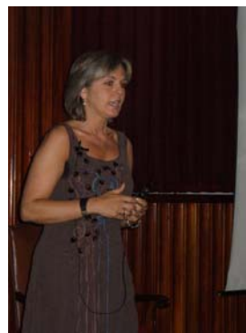
Momento de la intervención de cada uno de los ponentes de la mesa redonda