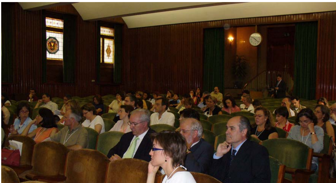
Aula Magna – Jornada inaugural – Asistentes