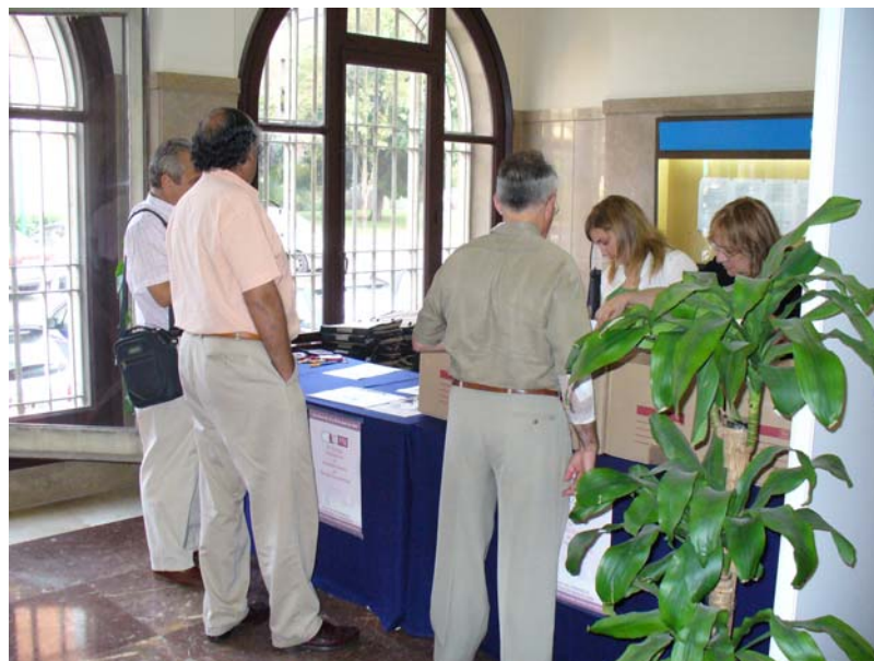
Secretaría técnica- acreditaciones