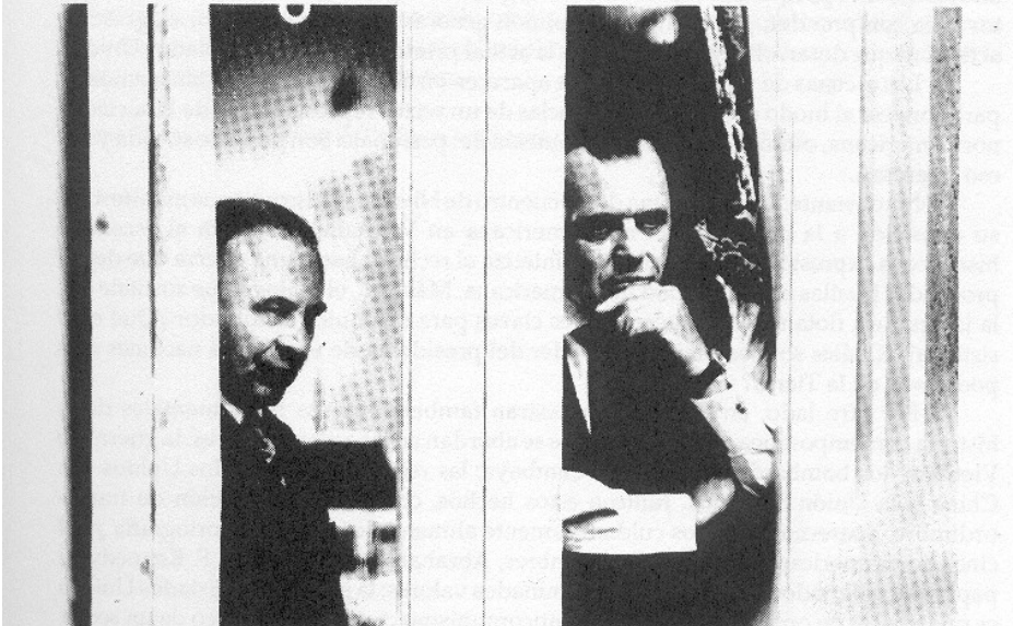
Dos planos de Nixon (1995).