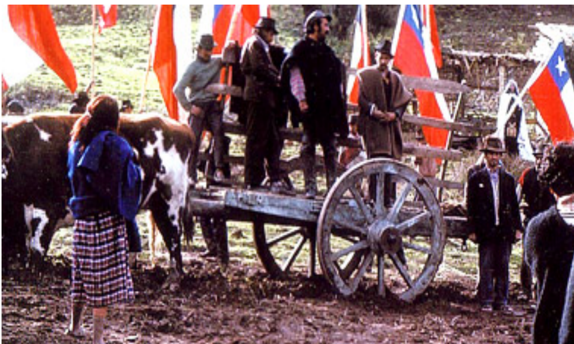
Figura 3: Imagen de La Tierra Prometida , de Littin, ejemplo de cine combatiente.

Para Gabriel uno de los mejores ejemplos de la etapa de cine combatiente en la cinematografía mundial es La tierra prometida de Miguel Littin (1971). Durante el gobierno de Allende, Littin ejerce como presidente de Chile Films y desde ahí dirige esta cinta que narra una toma de terreno en el gobierno socialista de Marmaduke Grove en 1932, pero al mismo tiempo explora el poder popular de su propio presente. En ella se enseña sobre cómo funciona el socialismo, se empodera al pueblo, y esto se hace con una referencia al pasado, (ya que de los narradores y protagonistas de la cinta recuerda su experiencia de infancia viviendo en la toma de terreno) pero con guiños de surrealismo, de un mundo de ensueño entre el pasado y el presente, y sin saberlo, también mostraba la eventual correspondencia de un pasado con el futuro que estaba por suceder: el violento final de la toma tras el fin del gobierno de Grove, es como el fin del gobierno de Allende y de la etapa combativa dentro de Chile.