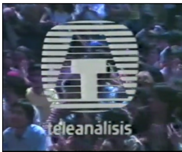
Figura 2: Logo de Teleanálisis . La mayoría del material se encuentra online en http://www.bibliotecamuseodelamemoria.cl

carbón en el Reino Unido y el video reportaje mensual Teleanálisis que desde 1984 hasta 1989 filmó y expuso lo que la prensa no podía o no quería mostrar en el Chile de Pinochet. A la vez, Teleanálisis representa quizás el mejor caso de la corriente alternativa de video Latinoamericano. Estas corrientes de video en vez de cine, eran sustentados por prácticas colectivas ‘desde abajo’, con fines ideológicos y comunicacionales, que verdaderamente no tienen intenciones comerciales en si mismos. Cómo el cine del manifiesto, estos no tratan de ilustrar pasivamente la realidad, sino que invitan a participar, responder y actuar al ver las imágenes presentadas. Son tercer cine. Como sostiene Chanan, el tercer cine no es sólo definido en torno a contenido sino también un proceso de producción. Este no pudo comenzar a existir antes de la masificación de las cámaras de 16mm, y los movimientos desde abajo no podrían haber existido si no fuera por las cámaras de video. 26 Así el presente del tercer cine está profundamente influenciado por la tecnología digital.